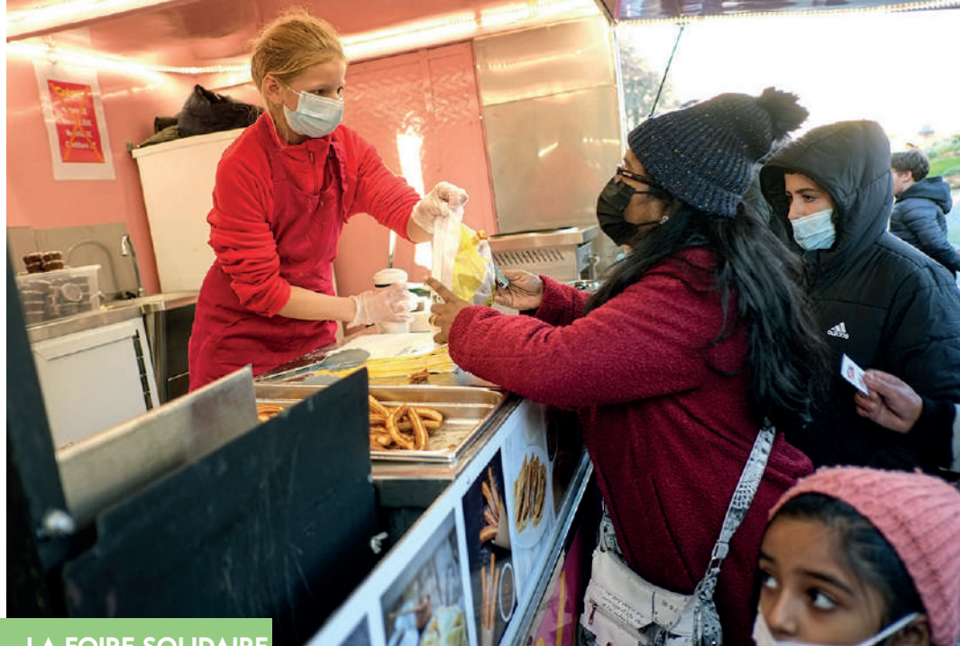
LA FOIRE SOLIDAIRE

Spectacles, manège, musiques et gourmandises ! La 3 e foire solidaire a tenu toutes ses promesses : visiteurs nombreux, animations musicales et culturelles, spectacle vivant et itinérant, manège à pédales pour les sportifs, et pour les gourmands... la baraque à churros qui n'a pas désempilé de tout l'après-midi ! Merci à tous les bénévoles (associations, Conseil des Jeunes) pour leur implication dans la réussite de cette édition. (Erwann QUÉRÉ)