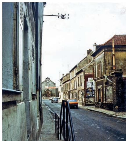
Ci-contre, le quartier que l'on appelait autrefois «Vieux pays» avec la rue Roger-Salengro et avant la construction de la cité Jean-Renaudie, dans les années 70.

V ous habitez, travaillez, étudiez à Villetaneuse. Vous connaissez Villetaneuse depuis toujours ou commencez tout juste à la découvrir. Vous avez croqué les fruits de ses vergers dans les années soixante ou vécu l'arrivée du tramway dans les années 2010. Qu'ils soient anciens ou récents, personnels ou collectifs, racontez-nous vos souvenirs et anecdotes de Villetaneuse ! Toutes ces histoires serviront de base à la création de vidéos pour raconter la ville en croisant les mémoires de toutes les générations.