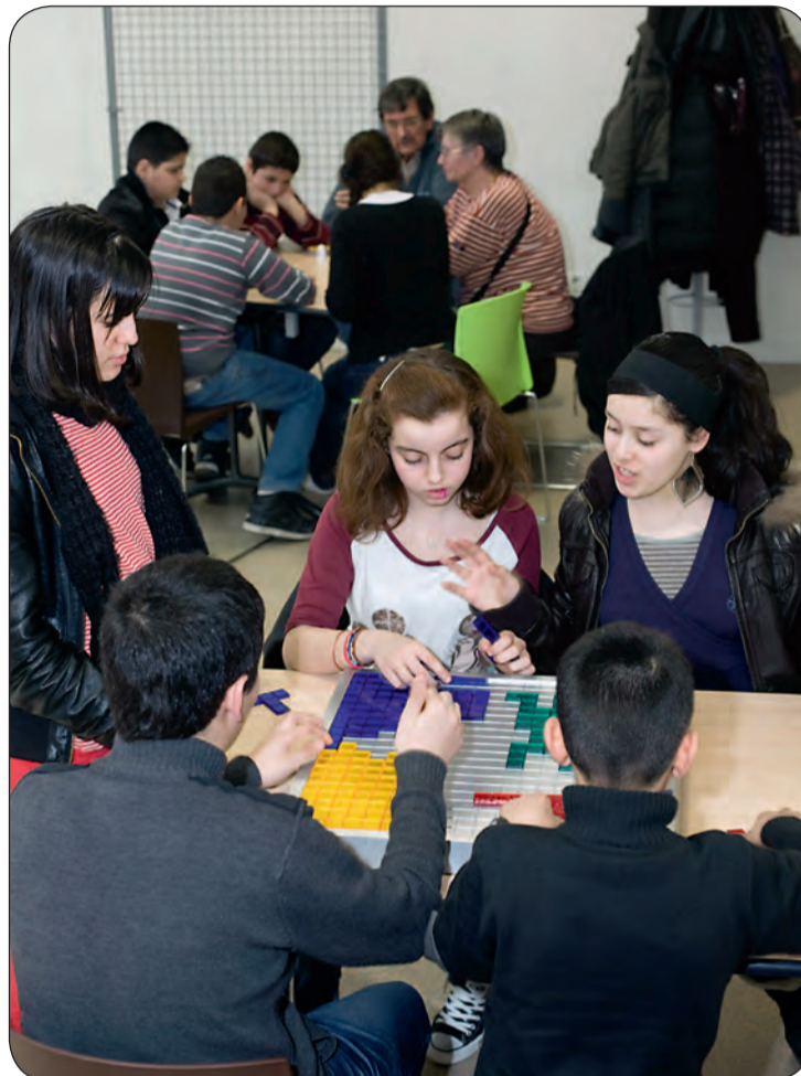
Durant une journée « jeux en famille » au centre Clara-Zetkin.

Cette séance collective était destinée à lancer le mouvement et proposer à tous de passer à l'action. Pour aller plus loin, un comité d'usagers sera bientôt sur pieds au centre socioculturel pour réunir les adhérents et continuer à faire émerger des projets et les faire vivre. N'hésitez pas ! Le centre est là pour faire bouger les lignes ! ●