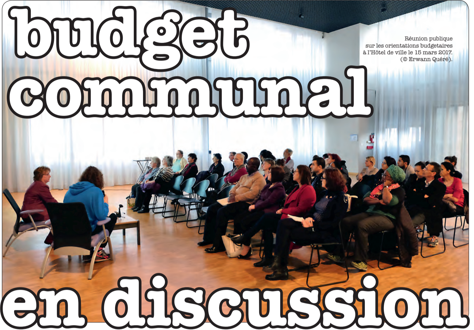
Réunion publique sur les orientations budgétaires à l'Hôtel de ville le 15 mars 2017.

Le budget 2017 sera voté en conseil municipal le 30 mars prochain. Les grandes lignes des orientations financières de la ville étaient présentées aux Villetaneusiens en réunion publique le 15 mars. Voir en page 3.