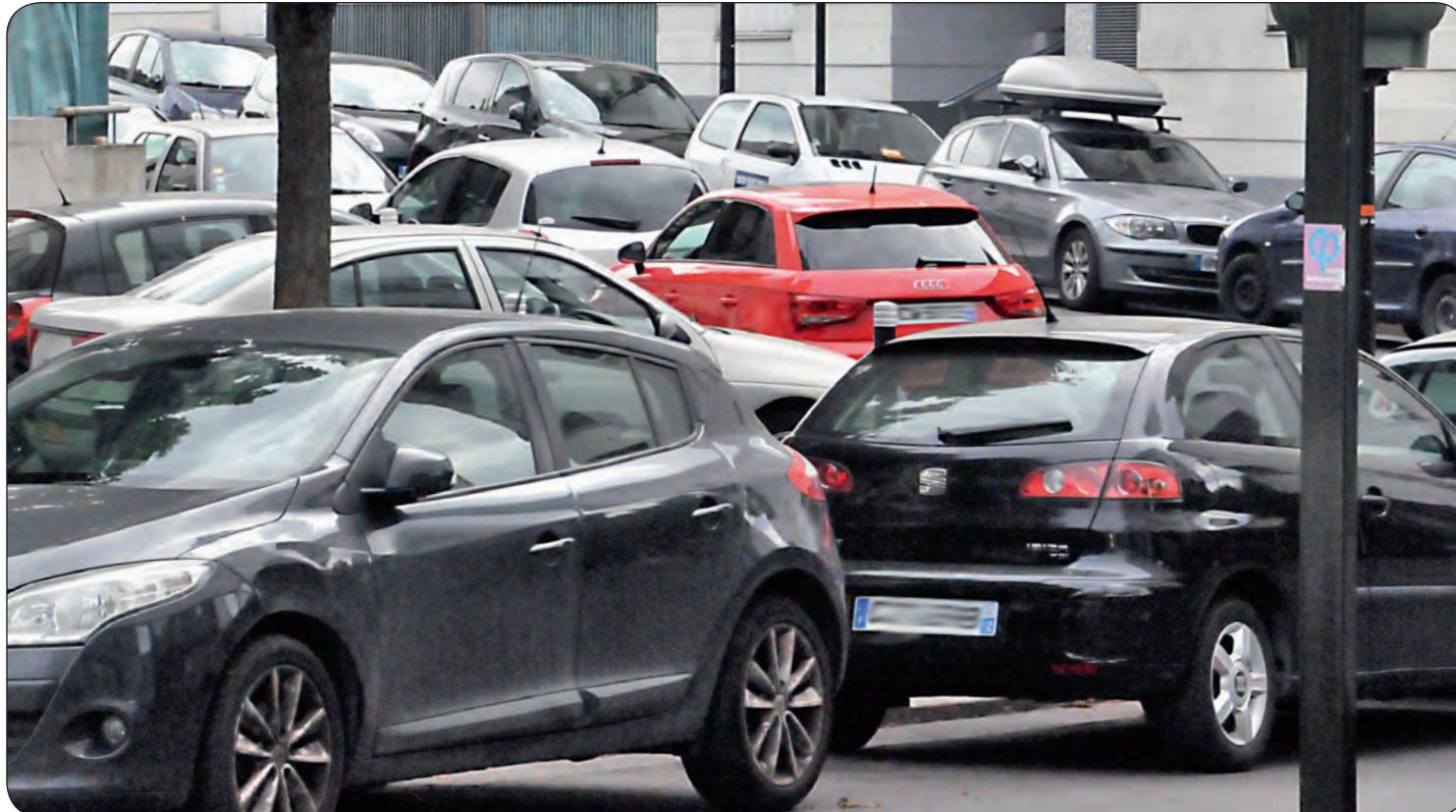
Le stationnement commence à connaître des niveaux de saturation importants à Villetaneuse. Sur l'ensemble de la commune, le taux de congestion atteint déjà 127% !

La Ville travaille actuellement à l'installation d'une zone bleue dans un périmètre de 500 mètres autour de la nouvelle gare du T11. Dans cette zone, le stationnement sera désormais limité et réglementé.