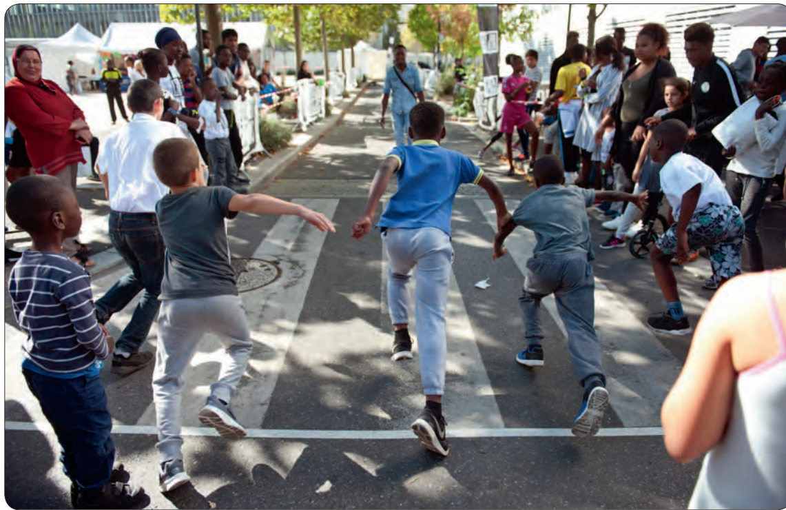
Durant la journée «Santé Ville» à la cité Salvador-Allende en septembre 2016.