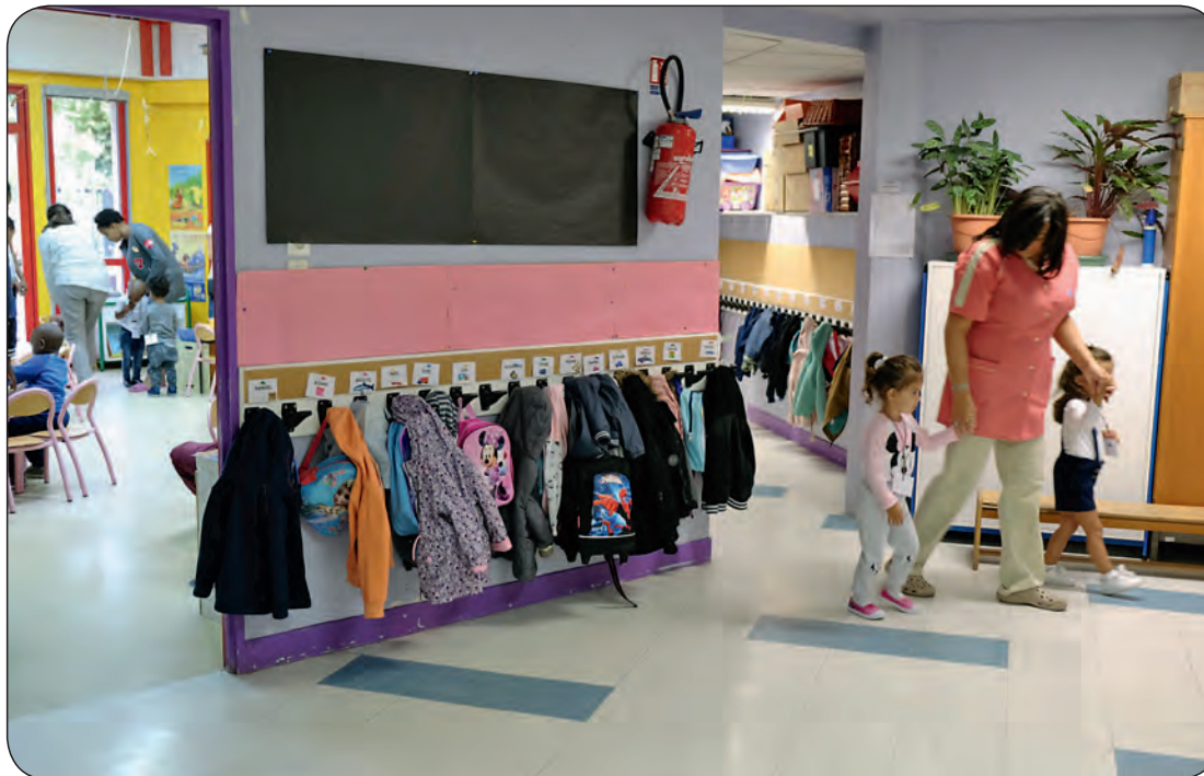
Rentrée 2017 de l'école Anne-Frank.

Si le domaine scolaire est assuré par l'Education nationale, ce que l'on appelle le périscolaire est lui assuré par la Ville. Il regroupe l'ensemble des services autour du temps de l'école, le matin, le midi et le soir et l'accueil en centre de loisirs le mercredi après-midi.