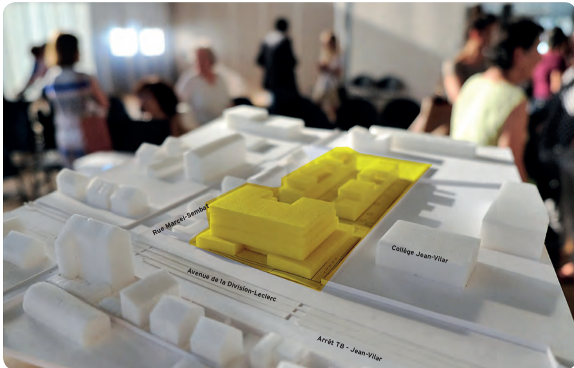
La maquette des architectes présentée lors de la réunion publique. Le projet de médiathèque et de logements est colorisé.

Situé avenue de la Division-Leclerc, à deux pas du collège Jean-Vilar, la nouvelle médiathèque s'installera sur 1440 m 2 sur deux niveaux autour de deux cours intérieures. Elle comprendra aussi un auditorium et intégrera un lieu dédié aux ados, en lieu et place de la maison de quartier Paul Langevin qui accueille aujourd'hui le centre de loisirs 11/17 ans. Aujourd'hui, les médiathèques évoluent, elles ne sont plus que des lieux dédiés seulement aux livres, mais ce sont ouvertes à beaucoup d'autres médias, notamment numériques. Sur le territoire de Plaine Commune, plusieurs équipements d'un nouveau type ont ouvert et rencontrent un franc succès. En effet, les médiathèques sont des lieux de diffusion culturelle mais aussi des lieux sociaux et conviviaux. Les orientations nationales en la matière confirment que celles-ci deviendraient des équipements de proximité beaucoup plus hybrides. Toutes ces réflexions convergent, et viennent conforter le projet porté par la municipalité de Villetaneuse : une médiathèque