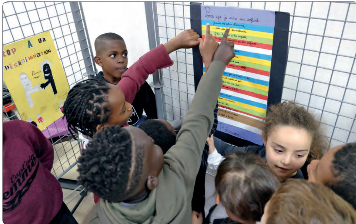
Les enfants du centre de loisirs Robinson expliquant et détaillant leurs créations.

L'année prochaine, la Convention Internationale des Droits de l'Enfant (CIDE) fêtera ses 30 ans. Adoptée le 20 novembre 1989 par l'assemblée générale des Nations Unies, et ratifiée par la France en 1990, cette convention comporte 54 articles couvrant l'ensemble des droits des enfants : droits civils et politiques, également économiques, sociaux et culturels. Elle s'attache aussi à consacrer la protection des enfants handicapés, des enfants issus de minorités et des enfants réfugiés. Elle repose sur 4 grands principes intangibles: la non-discrimination, l'intérêt supérieur de l'enfant, le droit à la vie et au développement, le respect de l'opinion de l'enfant. A Villetaneuse, cette convention s'illustre tous les automnes depuis 1998 par un concours d'expression artistique «Agis pour tes droits, de l'expression à l'action !» proposé par les Francas et mis en œuvre dans les écoles et les centres de loisirs. Il s'agit alors d'utiliser tout mode d'expression, arts plastiques, écriture, chant, vidéo, création de jeu ou autre, pour porter la parole de chacun des enfants autour de la CIDE. Cette année, 8 affiches et 2 vidéos "concouraient" abordant des thèmes aussi divers que la famille, les rêves, le respect, la joie d'être