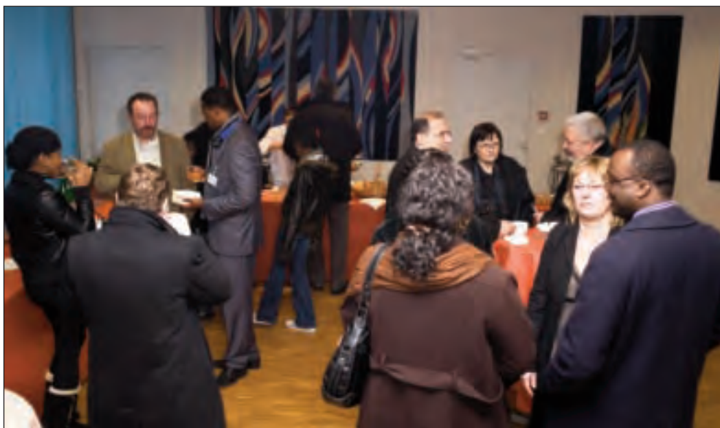
Les nouveaux habitants étaient venus en nombre le 27 novembre dernier en mairie découvrir les services municipaux et rencontrer les élus.