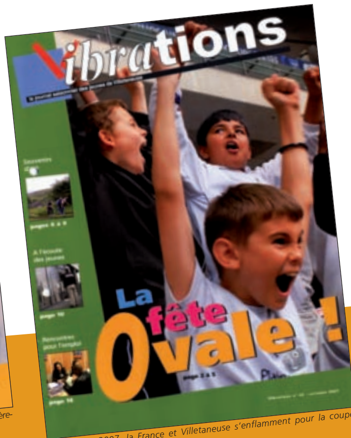
Septembre 2007, la France et Villetaneuse s'enflamment pour la coupe du monde de rugby.