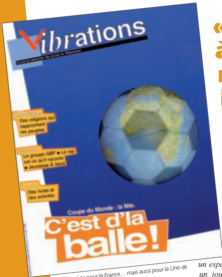
Grande date pour la France... mais aussi pour la Une de Vibrations !