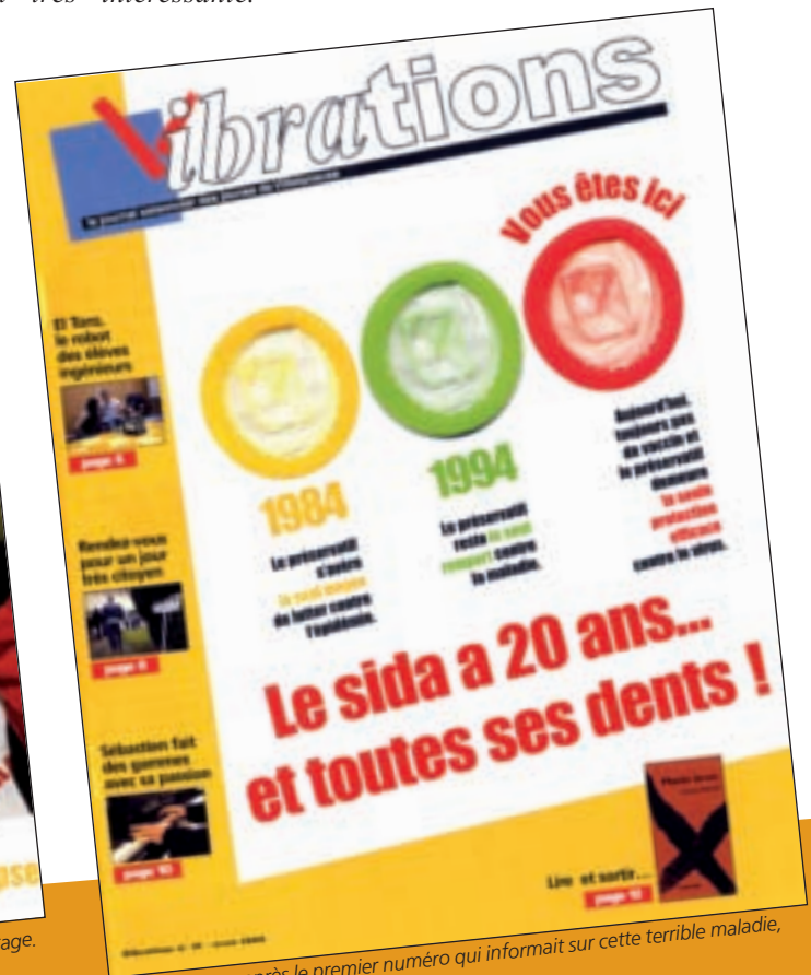
2004, huit ans après le premier numéro qui informait sur cette terrible maladie, le SIDA était encore là...