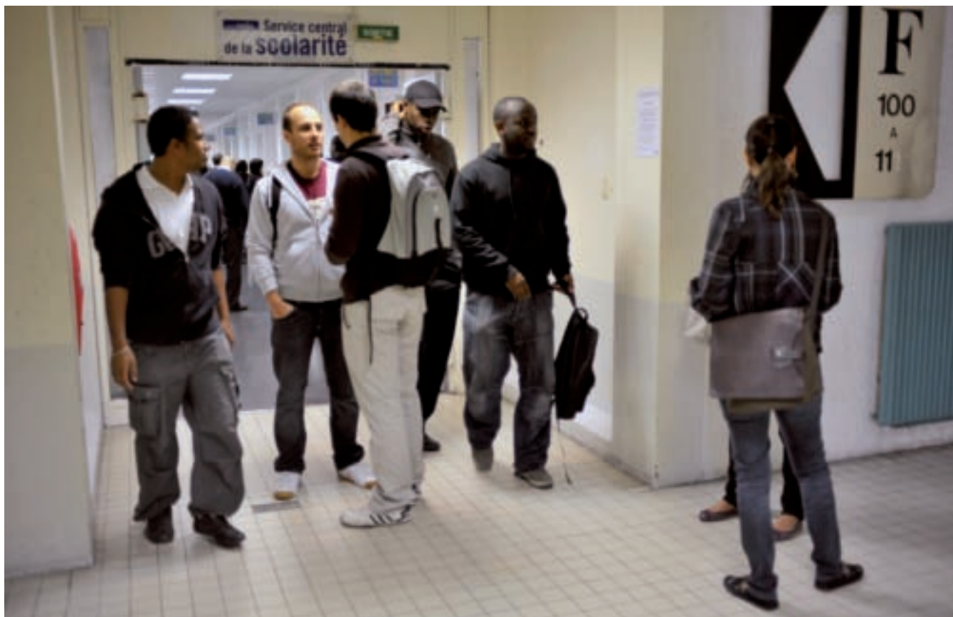
Le couloir de la Scolarité à l'Université Paris 13 où les étudiants viennent s'inscrire en début d'année

L'université de Paris 13 n'a pas échappé à la vague de protestation qui a traversé les facs ces dernières années. Les réformes se succèdent au même rythme que les grèves. Paris 13 a ainsi été bousculée par deux grands mouvements de grèves en deux ans, dont le second long de quatre mois, dans le cadre de la lutte contre la LRU (Loi établissant les Libertés et les Responsabilités des Universités), plus communément appelée réforme d'autonomie des universités. Preuve est faite que la Fac est toujours là et bien vivante !