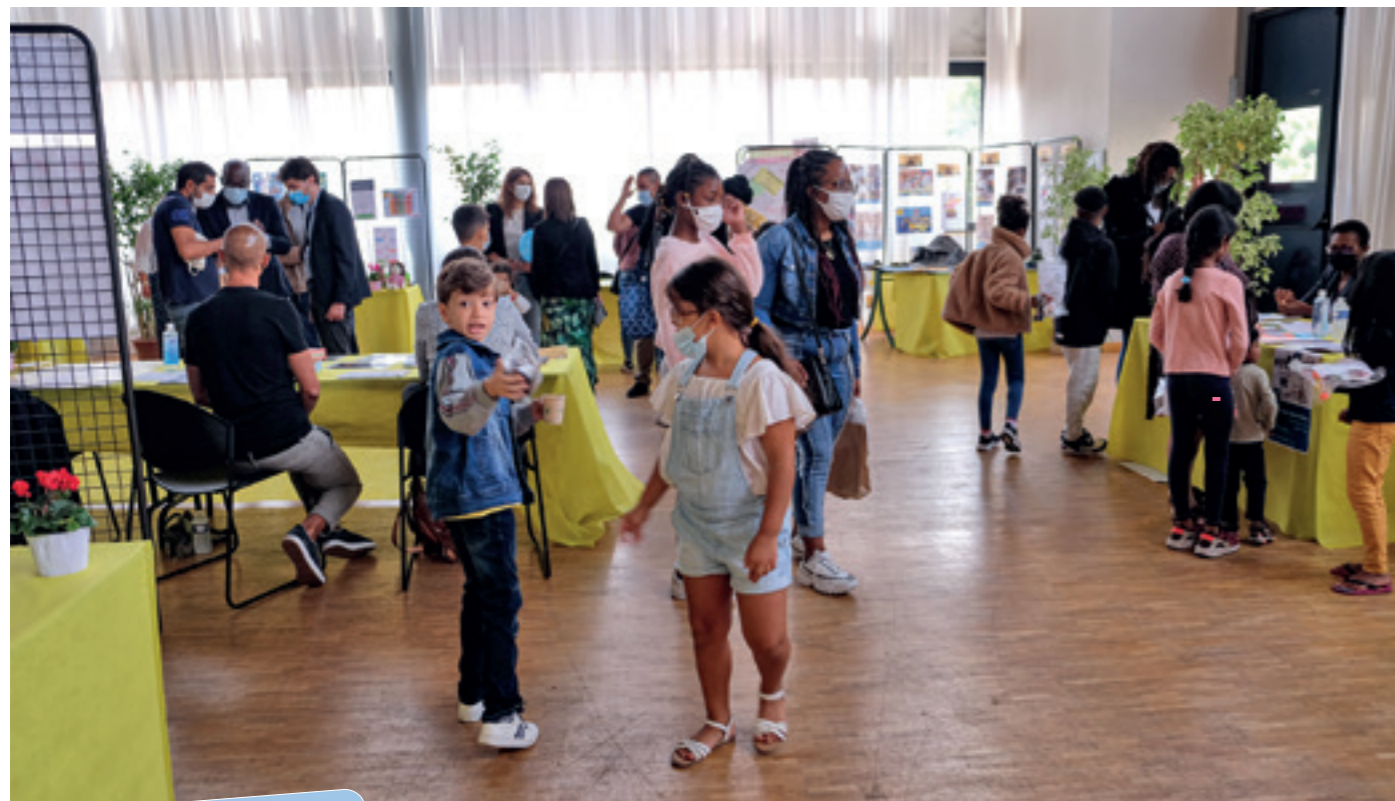
Edition 2021 du Forum de la Rentrée.

Pour une bonne reprise en famille et sans stress, samedi 3 septembre, ne manquez pas le Forum de la Rentrée à l'Hôtel de Ville de 9h à 15h pour retirer vos fournitures, découvrir toutes les activités de loisirs et connaître l'ensemble des services municipaux. L'occasion aussi de faire le tour des nouveautés de la rentrée.