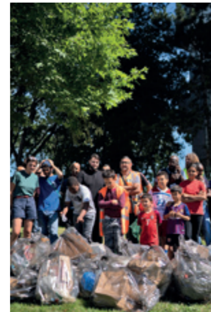
L'opération de nettoyage de juillet dernier dans le sud de Villetaneuse.