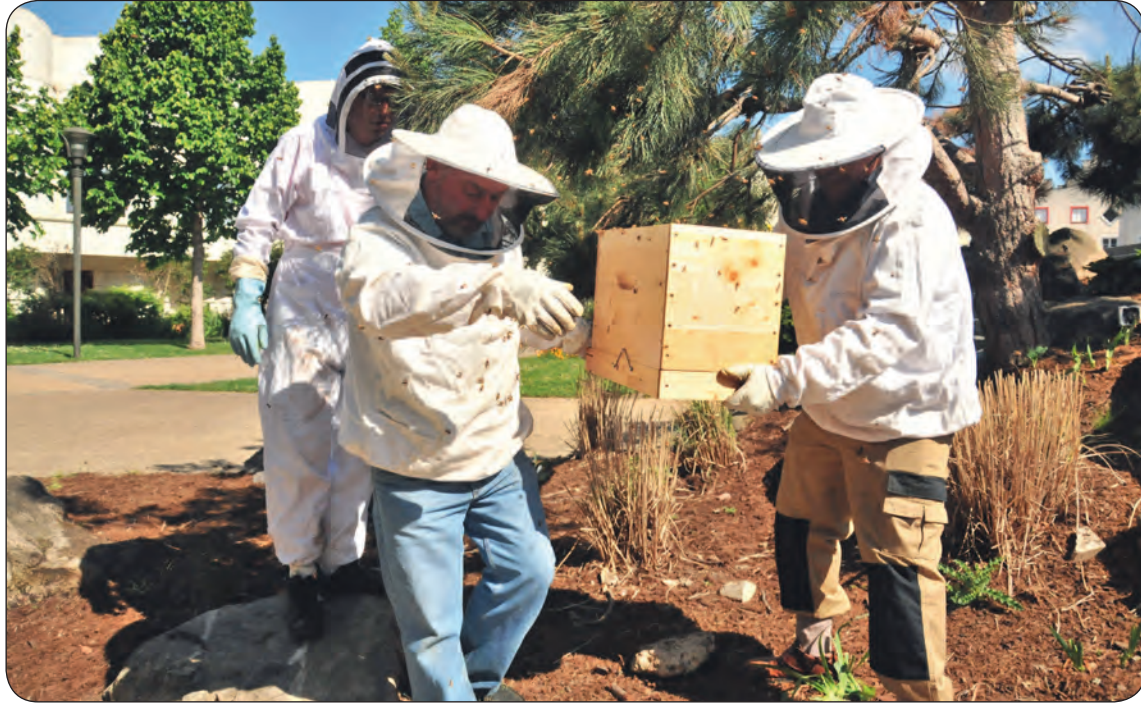
Enruchement dans le jardin Baldaccini, au pied de l'hôtel de ville, par l'association «À l'école des abeilles».