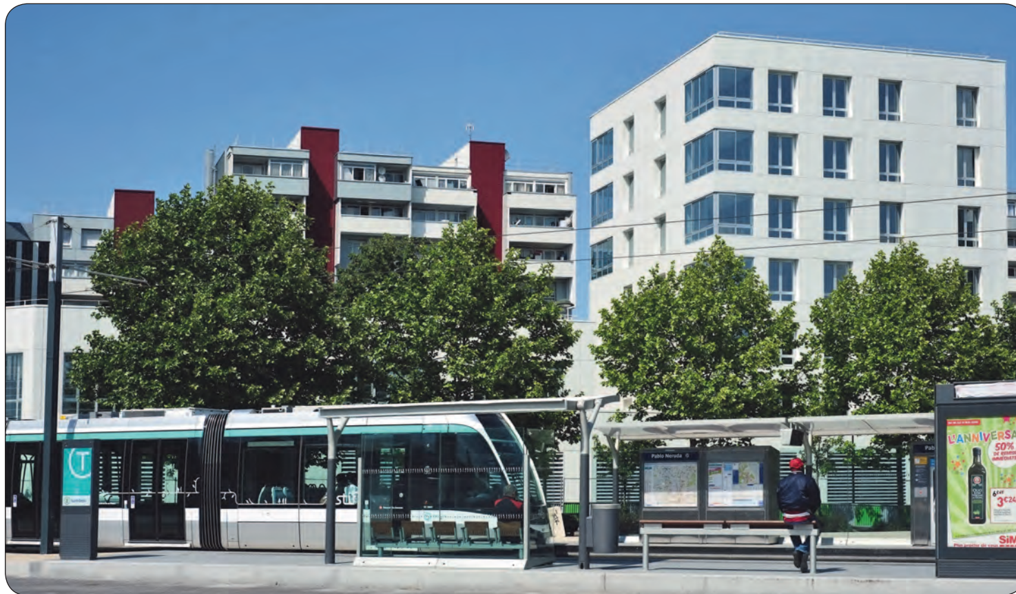
Les logements situés au dessus de la Maison de l'Emploi et de la Formation pourront accueillir 39 étudiants-chercheurs en colocation. (© Erwann Quéré).

A deux pas de la station de tram Pablo-Neruda, les travaux de la nouvelle Maison de l'Emploi se terminent. Au dessus de cet équipement se trouvent 12 logements. Ceux-ci étaient dans un premier temps dédiés à l'accession à la propriété. Face aux difficultés de commercialisation, le projet n'a pu aboutir. Aussi, ces logements vont être transformés pour accueillir des étudiants-chercheurs en colocation.