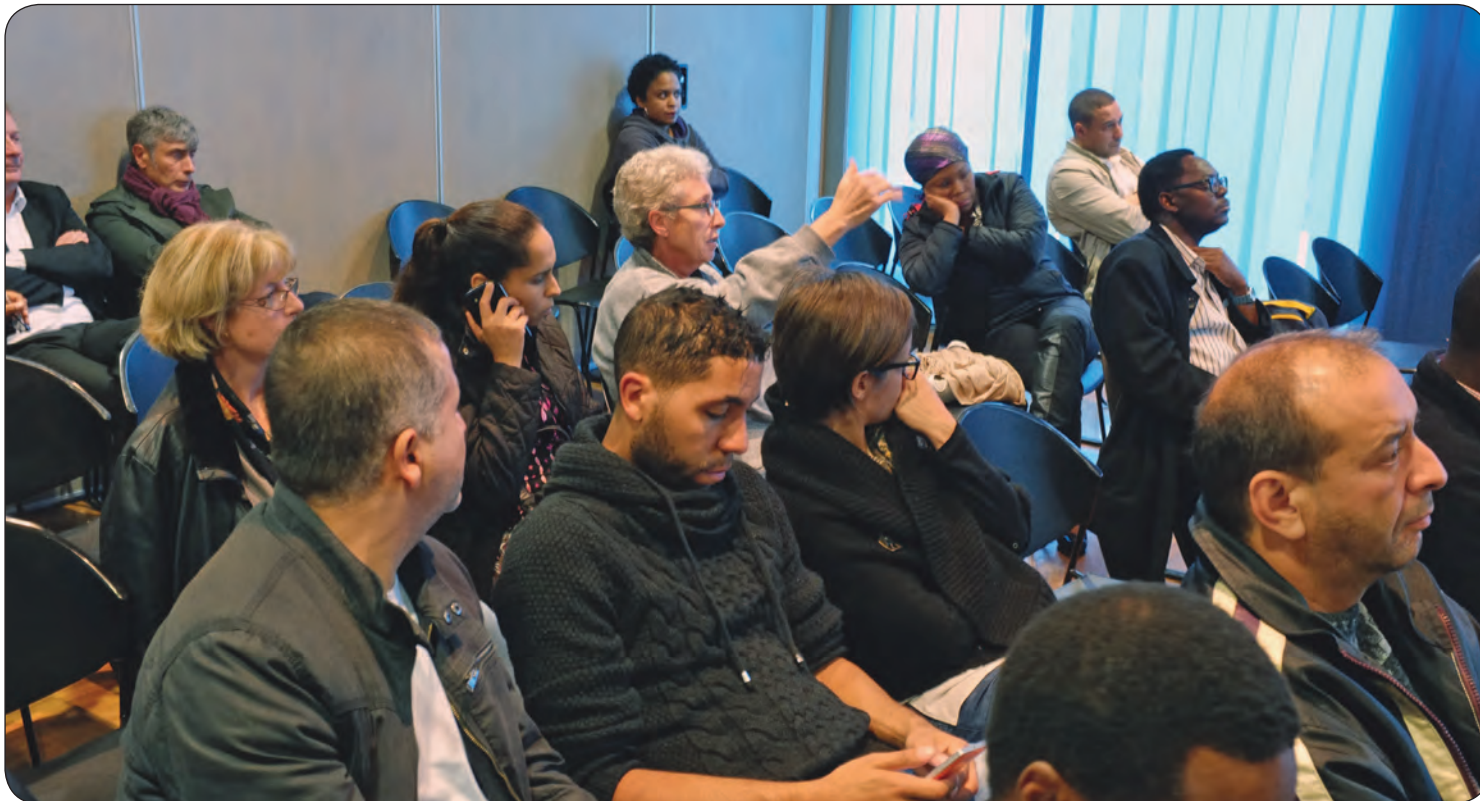
Le 16 septembre dernier, durant le comité de quartier du centre ville qui concernait la poursuite du déploiement de la fibre optique.

Resserrer les liens entre habitants, élus, services municipaux et ceux de Plaine Commune pour la mise en œuvre des politiques publiques et l'élaboration de projets concernant votre quartier et la ville. Les comités de quartier sont des lieux d'informations, d'échanges et de débats réguliers ouverts à tous.