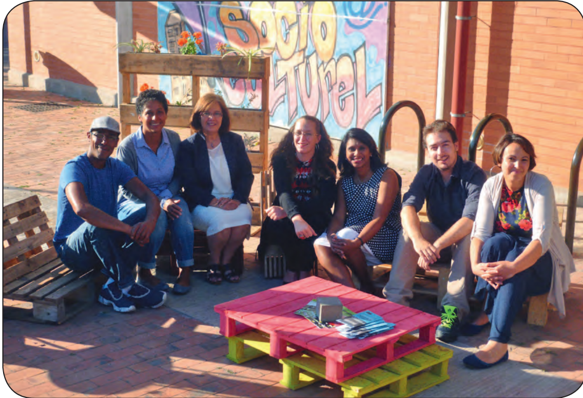
Toute l'équipe du centre socioculturel Clara-Zetkin vous accueille toute l'année pour élaborer avec vous et les élus délégués à la vie associative et à la culture la programmation de la structure.

« Clara Zetkin », c'est un espace de proximité ouvert à tous les Villetaneusiens.