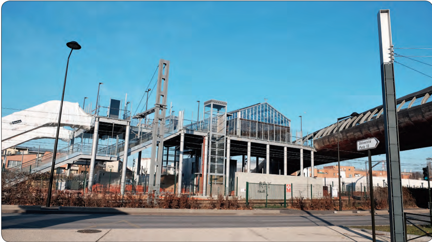
La future gare du T11 Express à Villetaneuse : il ne reste bientôt plus qu'à déballer les escaliers mécaniques.

Alors que ce tram-train reliant Epinay au Bourget en passant par Villetaneuse doit entrer en fonction en juillet 2017, plusieurs sujets d'inquiétudes apparaissent. Son exploitation pourrait être confiée à une filiale de droit privé et non plus à la SNCF. D'autre part, la mobilisation se poursuit pour assurer le prolongement de cette ligne.