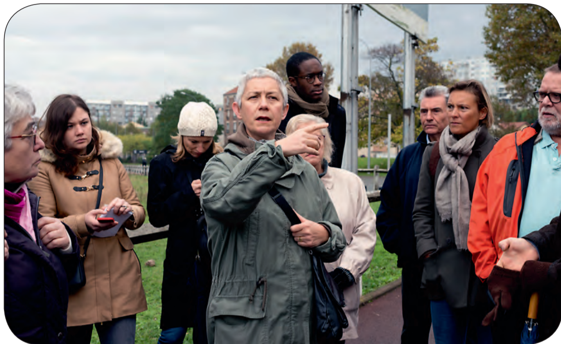
Durant une balade urbaine sur les sites olympiques retenus en Seine-Saint-Denis.

Les immeubles du village olympique qui accueilleront les athlètes seront imaginés dès leur conception comme de futurs bureaux, équipements publics, logements ou pépinières d'entreprises. La plupart des projets urbains sur la zone est d'ores et déjà engagée. La création du village olympique permettra de conforter des projets structurants tels que le franchissement Pleyel et une passerelle-bus entre L'Île-Saint-Denis et Saint-Denis. De même, les