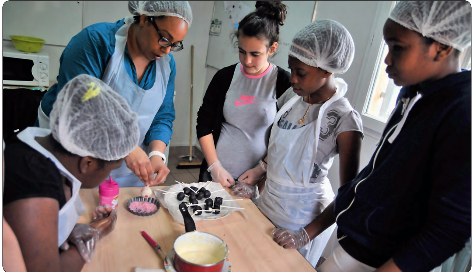
Confection de gourmandises au centre de loisirs ados.

Chez Clara-Zetkin, ce mois de février sera placé sous le signe du Japon. Le manga sera à l'honneur toute la journée du samedi 4 février, avec des ateliers et la projection, en début de soirée, du film d'animation «Patéma et le monde inversé» écrit et réalisé par Yasuhiro Yoshiura. Le lundi 6 février à 14h découvrez l'art du pliage avec un atelier origami et paper-craft à partir de 6 ans. Cette discipline consiste à réaliser un objet à partir d'un morceau de papier carré et en n'utilisant que la technique de pliage (en japonais, «Ori» veut dire plier et «Gami» papier). Il est donc interdit de couper ou de coller ! Le centre socioculturel vous invite à découvrir quelques secrets de cet art du pliage, mais aussi d'autres idées de paper-craft pour fabriquer des objets à base de papier... La semaine se poursuit en musique avec un jeu musical en famille , le mercredi 8 février à 14h : blind test, chanson à mimer, chanson fredonnée, chanteur, chanson inventée... Retrouvez les grands