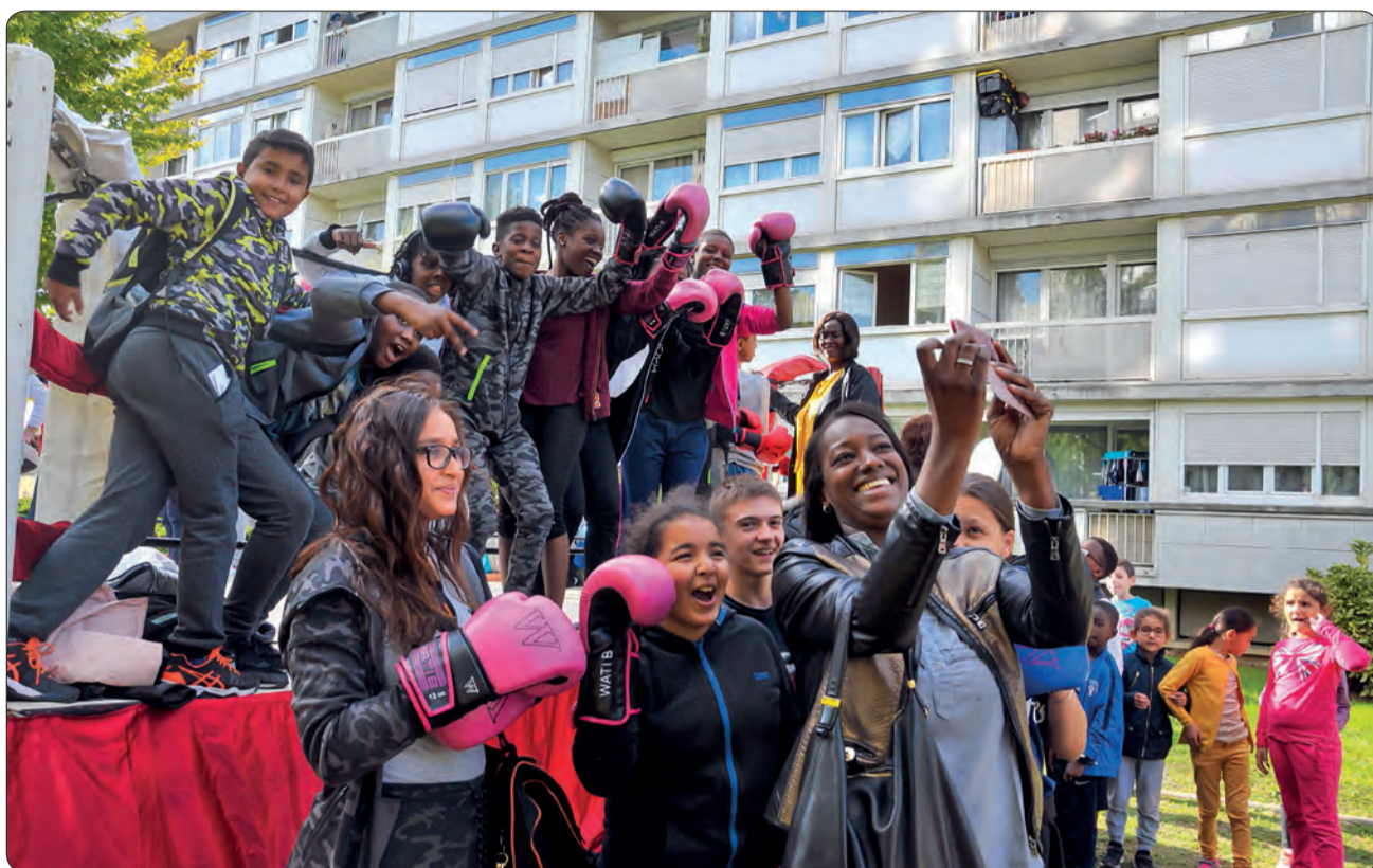
Ecoresponsabilité avec l'opération "Villeta'neuf" !

Dans les années à venir, les quartiers Langevin et Saint-Leu vont vivre des bouleversements importants dans le cadre du programme de rénovation urbaine. Avant les grands travaux, de nombreuses actions sont mises en œuvre avec les habitants pour améliorer leur cadre de vie.