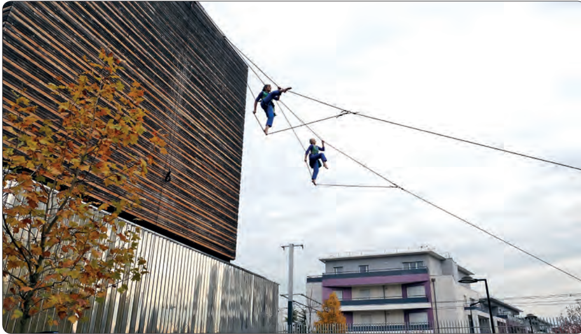
Des danseuses de la Cie Retouramont contre le gymnase Jackson-Richardson en novembre 2017.