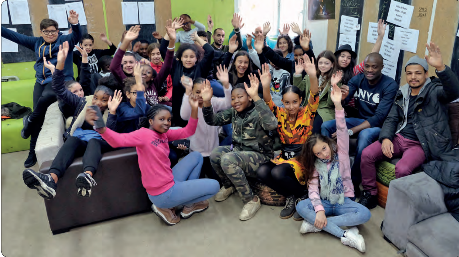
Les ados Perpignanais et Villetaneusiens à la Maison de quartier Paul-Langevin.

Les voyages forment la jeunesse dit-on... On pourrait ajouter que les échanges nourrissent l'expérience ! C'est exactement ce qu'expérimentent alternativement les structures jeunesse de Perpignan et de Villetaneuse depuis l'été 2016 avec la volonté commune de s'ouvrir aux autres, changer d'horizons, s'enrichir mutuellement.