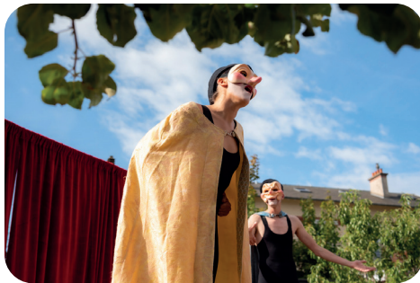
© Markoliver - Cie Les Allumeurs de Réverbères

50 rue Roger-Salengro • 93430 Villetaneuse