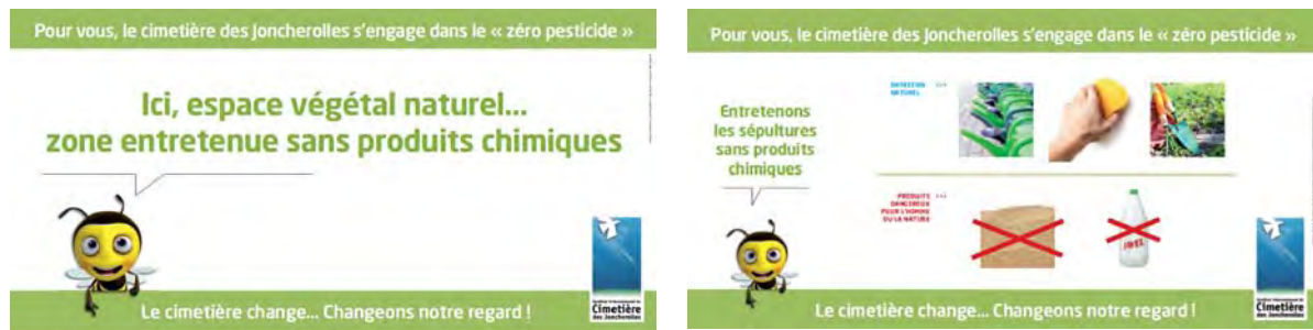
Campagne d'affichage « Laissons place à la nature : passons au zéro-pesticides » réalisée en 2013