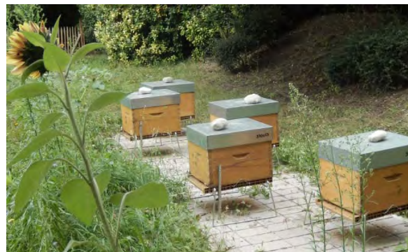
Le rucher du cimetière intercommunal des Joncherolles

Un rucher composé de 5 ruches a été installé dans l'enceinte du cimetière au printemps 2013. Pour l'installation et le suivi des ruchers, le syndicat a conclu une convention avec l'association « A l'école des abeilles de la Butte Pinson ». Des plants mellifères et une prairie naturelle ont été implantés à proximité des ruches afin de favoriser le butinage des abeilles, de nettoyer le sol de manière naturelle et de fabriquer de l'humus (engrais naturel). La première récolte de miel a eu lieu à l'été 2014. Des panneaux d'informations ont été mis en place afin d'informer les usagers du cimetière.