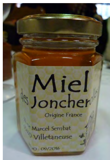
Première récolte de miel – Automne 2014