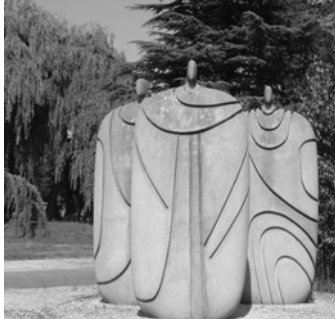
Les Trois Parques de Maurice Calka