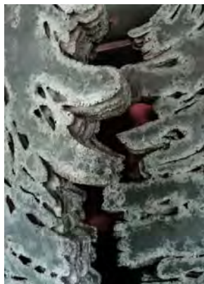
Les portes de l'au-delà de Pierre Sabatier