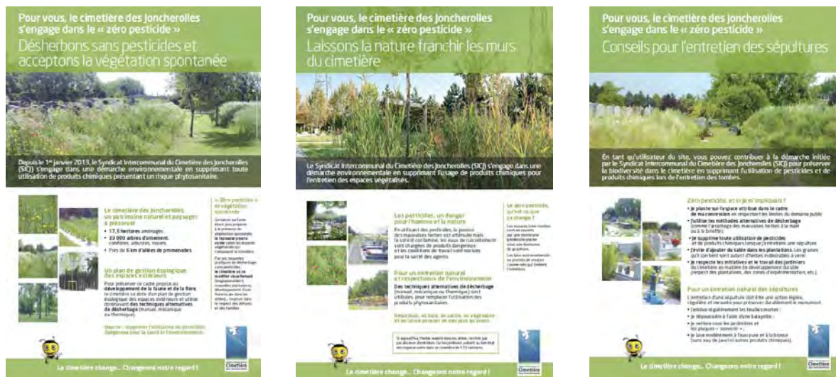
Campagne d'affichage « Laissons place à la nature : passons au zéro-pesticides » réalisée en 2013

Une campagne de communication « Laissons place à la nature : passons au zéro pesticides » a été créée afin de sensibiliser les familles et visiteurs du cimetière, à la biodiversité.