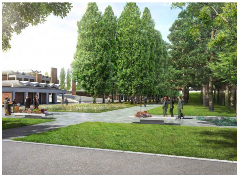
Jardin du souvenir